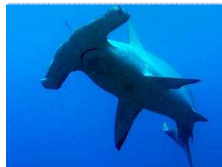
Le requins Marteau (sphyrna spp)

Voir l'organe de gestion de CITES Guinée